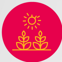
Implementación de huertos